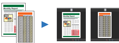
Hojas de diferentes tamaños Tamaño ajustado automáticamente