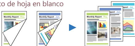
Dos documentos con una cara en blanco Hojas blancas no son escaneadas